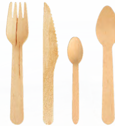
RÉF. 5396 R.É.F. 5395 R.É.F. 132444 R.É.F. 5397